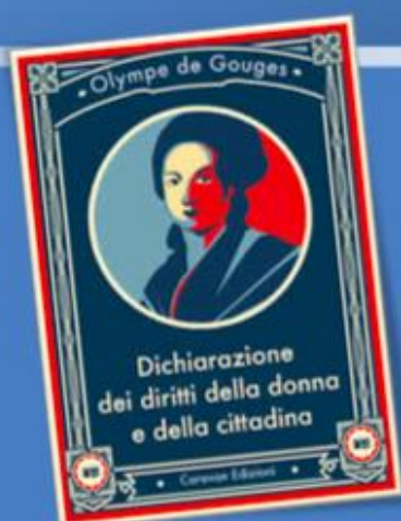
Figure femminili nell'età moderna