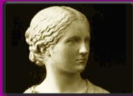
Figure e voci di donna nell'età antica

"La sapienza [...] appartiene al novero delle cose più belle, e Amore è amore riguardo al bello, tanto che è necessario che Amore sia filosofo e, essendo anche filosofo, se ne sta in mezzo al sapiente e all'ignorante"